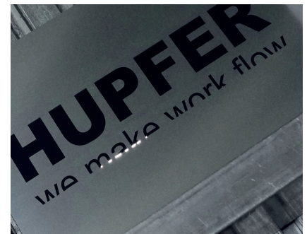
3-D, Laser, Robotik: Bei uns täglich im Einsatz