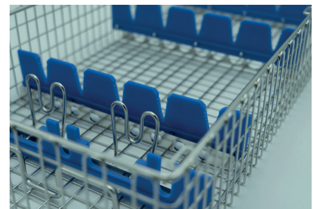
Maßanfertigung: Wir entwickeln individuelle Lösungen für individuelle Anforderungen