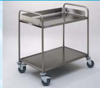
Carro de recogida ARW 10 x 6/2 , provisto de 2 estantes de 1000 x 600 mm.

Todos los estantes disponen de refuerzo inferior (perfil en Z) - para la máxima capacidad de carga en el trabajo diario. La galería a 3 lados con una altura de 230 mm permite una carga alta y con ello la máxima capacidad en el menor espacio. Las medidas de los estantes son 1000 x 600 mm. Todos los carros de recogida de HUPFER® están fabricados en acero inoxidable 18/10, material 1.4301, con un acabado de alta calidad.