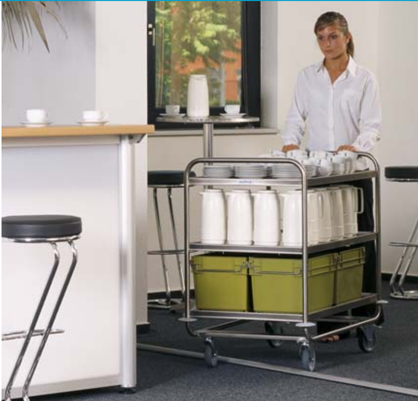
Carro de servicio SSW 10 x 6/3 , versión reforzada, provisto de 3 estantes de 1000 x 600 mm. Incluso con la carga máxima esta línea de aparatos supera de forma fácil y sencilla irregularidades extremas del suelo.

...carros de servicio HUPFER® para carga máxima!