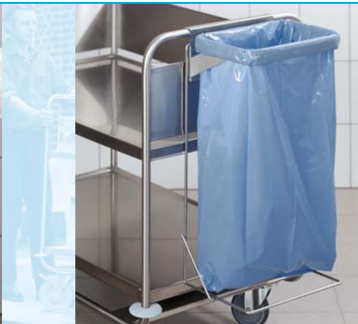
El accesorio de marco para soporte de sacos para desperdicios es apropiado para aplicación en todos los modelos 8 x 5 y 10 x 6.

Depósito GN para cubiertos, tamaño 1/3 GN, de acero inoxidable 18/10, material 1.4301. Apropriado para todos los modelos.