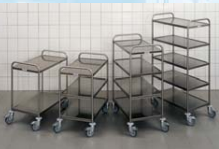
Foto arriba: carro de servicio estándar SW 6 x 4/2 , provisto de 2 estantes 600 x 400 mm.