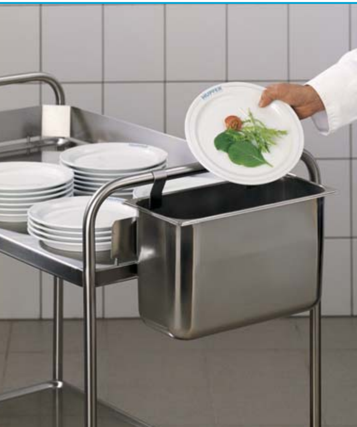
Depósito de recogida con dispositivo de enganche, de acero inoxidable 18/10, material 1.4301. Apropriado para todos los modelos 8 x 5 y 10 x 6.

...para optimizar la facilidad en el trabajo y del proceso!