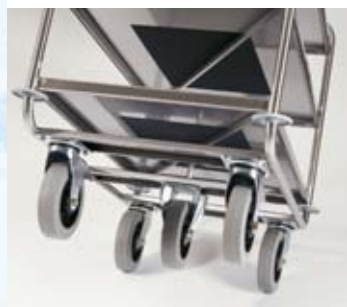
Los estantes de la serie SSW-ERGO están equipados con un refuerzo inferior (perfil en Z) - para la máxima estabilidad y máxima capacidad de carga. En la serie SW-ERGO el estante superior está equipado con un refuerzo inferior (perfil en Z).