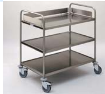
Carro de recogida ARW 10 x 6/3 , provisto de 3 estantes de 1000 x 600 mm.