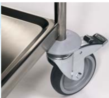
En los rincones el estante presenta radios de fácil limpieza.