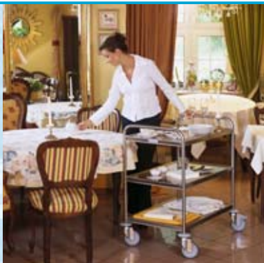
Carro de servicio estándar SW 8 x 5/3 , provisto de 3 estantes de 800 x 500 mm.