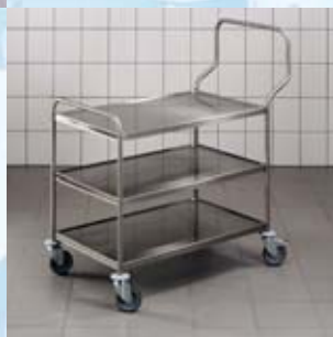
Carro de servicio SW 10 x 6/3 ERGO , provisto de 3 estantes de 1000 x 600 mm. Los carros de servicio de esta serie de modelos destacan por sus aspectos ergonómicos especialmente por su asa de empuje de altura entre 900 - 1250 mm y desplazada adicionalmente.

Los carros de servicio HUPFER® de la serie SSW-ERGO se distinguen especialmente por su asa de empuje asimétrica de altura 1250 mm - para una manipulación óptima y con ello también una simplificación en el trabajo diario. La serie fabricada en acero inoxidable 18/10, material 1.4301, está formada por 4 modelos distintos. Gracias a una construcción extremadamente robusta tenemos garantizada una gran capacidad de carga. La estructura cerrada se compone de un tubo de Ø 25 mm. En el interior, y según el modelo, 2 hasta 3 estantes soldados con reborde perimetral alzado. Cada estante admite un carga de hasta 60 Kg.