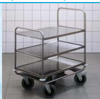
Carro de servicio SSW 10 x 6/3 ERGO , provisto de 3 estantes 1000 x 600 mm. Altura de agarre ergonómica: 900 - 1250 mm.