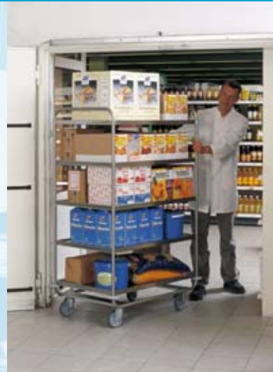
Carro de servicio SSW 10 x 6/5 , versión reforzada, provisto de 5 estantes de 1000 x 600 mm.