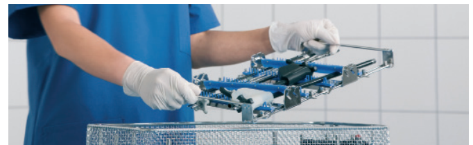
Tutto al suo posto: fissaggio sicuro degli strumenti, anche quando si è in movimento

Chi non conosce la pratica, non può produrre prodotti adatti alla pratica. Siamo in costante scambio con i nostri clienti - perché l'innovazione nasce solo dal dialogo.