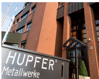
La nostra casa madre a Coesfeld, Westfalia