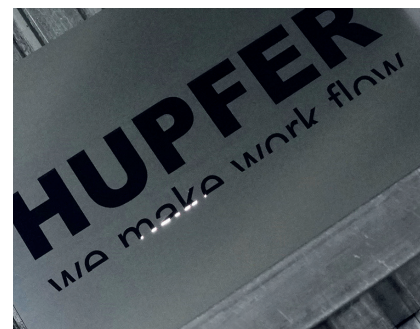
3-D, laser, robotica: da noi in uso