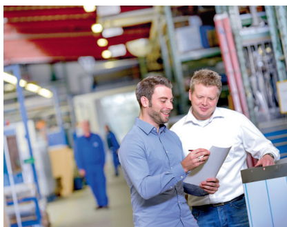
Sviluppare la migliore soluzione insieme