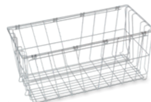
N.º de artículo: 7501862