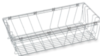
N.º de artículo: 7501861