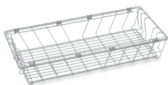
N.º de artículo: 7501863

Los distintos modelos de cestas se pueden apilar unos dentro de otros o unos sobre otros, según se prefiera.