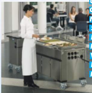
C O N S E R V E R