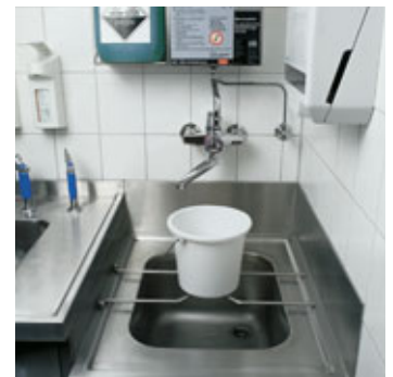
Lavello con grigliato ribaltabile.