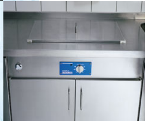
Possibilità di integrare nella parte armadiata vasche ad ultrasuoni.

Al di sotto del piano di lavoro possono essere collocati armadietti sia in appoggio al muro, sia appositamente realizzati a creare corpo unico con il piano.