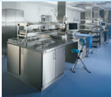
Doppio tavolo di confezionamento con alzatina centrale.