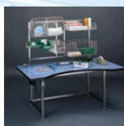
Tavolo di confezionamento regolabile idraulicamente.