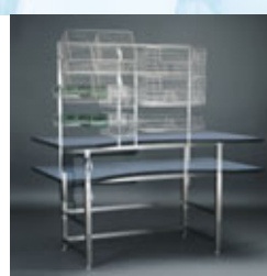
Tavolo di confezionamento attrezzato nella parte superiore.

Il tavolo di confezionamento HUPFER® può essere regolabile in altezza grazie ad un sistema idraulico, elettrico o meccanico. L'intera struttura può essere attrezzata per il contenimento di cestelli ISO e StE. Nella parte superiore può essere posto un monitor o un telaio con ganci. Su questa struttura possono essere agganciati i cestelli HUPFER® StE nelle diverse misure o accessori della vasta gamma, al fine di soddisfare al meglio le esigenze del cliente.