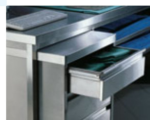
Elemento mobile con cassetiera.

Gli armadi HUPFER® sono il prodotto ideale per lo stoccaggio e l'approvvigionamento. Sono interamente realizzati in acciaio inossidabile 18/10, hanno un'ottima qualità e garantiscono un'igiene perfetta. Il nostro programma prevede un'ampia gamma di modelli: armadi aperti e chiusi, posti sopra o sotto il piano di lavoro e con ante scorrevoli o battente, in base alle necessità del cliente. Le armadiature sono attrezzabili con cassetti. Per stoccaggi lunghi nel tempo, delle guarnizioni poste ai bordi delle ante e dei cassetti, evitano il passaggio della polvere. Le ante possono avere diversi tipi di maniglia: integrata a profilo incassato per l'intera altezza dell'anta o fissa in tondino ed apertura con pulsante.