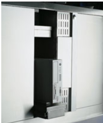
Sistemazione del computer nell'armadiatura inferiore.