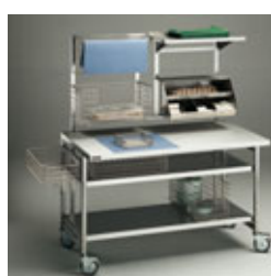
Tavolo mobile di confezionamento dotato di telaio attrezzabile.