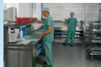
Tavoli angolari con piano d'appoggio inferiore.