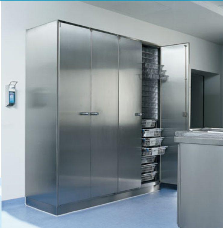
Armadio alto con pareti interne in plastica.