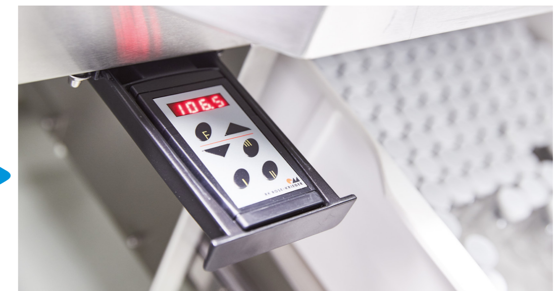
Ergonomisch wertvoll: Stufenlos höhenverstellbare Arbeitstische für eine optimale Arbeitsposition.