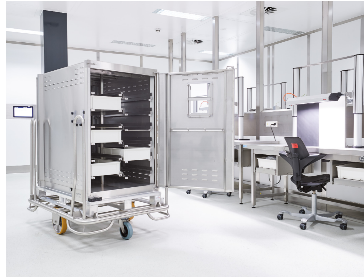
Gut verpackt: Der geschlossene Transport-Container kann bis zu 24 Kunststoff-Trays aufnehmen. Der Container ist für den Automatischen-Waren-Transport (AWT) optimiert.

Dieter Althoff, Hupfer Key-Account-Manager