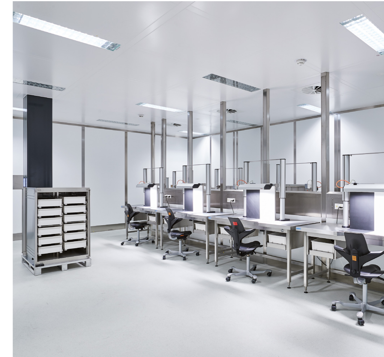
Maßgeschneidert: Die Inspektionstische mit verstellbarer Arbeitshöhe und schwarz-weißer Prüffläche sind Hupfer-Sonderanfertigungen.

Dieter Althoff, Hupfer Key-Account-Manager