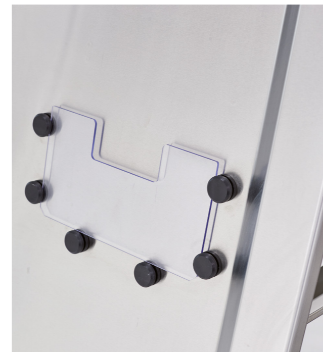
Praktisch: Halterung für Begleitpapiere sind außerhalb und innerhalb des Containers verbaut.

„Durch maßgeschneiderte Lösungen können wir Prozesse kundenindividuell optimieren.“