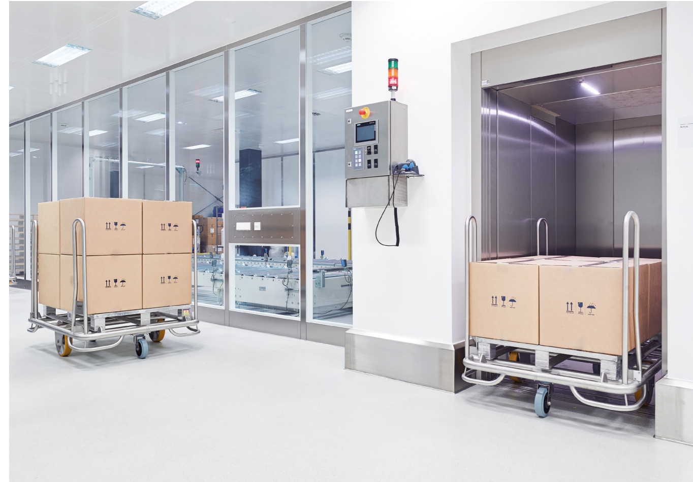
Es geht los: Der Paletten-Transportwagen dient zur Aufnahme der angelieferten Produkte. Die Sondermaße ermöglichen den praktischen Transport im Aufzug. Der vierseitige Stoßschutz ist speziell auf die bauseitige Sockelhöhe abgestimmt.

„Mit unseren Produkten können wir verschiedenste Reinraumklassen bedienen.“