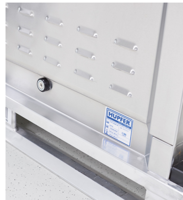
Prima Klima: Die extra eingepprägten Kiemen gewährleisten eine optimale Luftzirkulation und Verringerung der Feuchtigkeit, bei einer Lagerung im Kühlhaus.