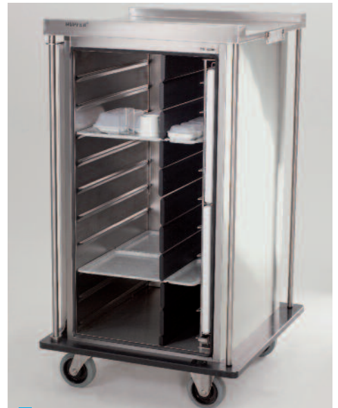
Beispielbestückung mit Porzellan-Norm-Geschirrtteilen im Warm- und Kaltbereich.