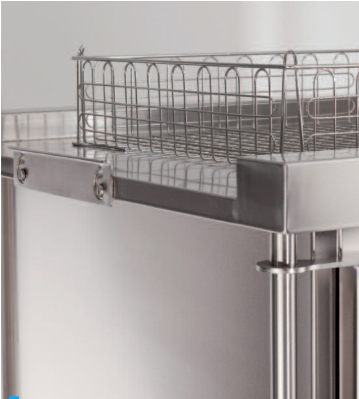
Optionale Transportsicherung an beiden Stirnseiten für zum Beispiel Korbtransport auf der Wagendachfläche.