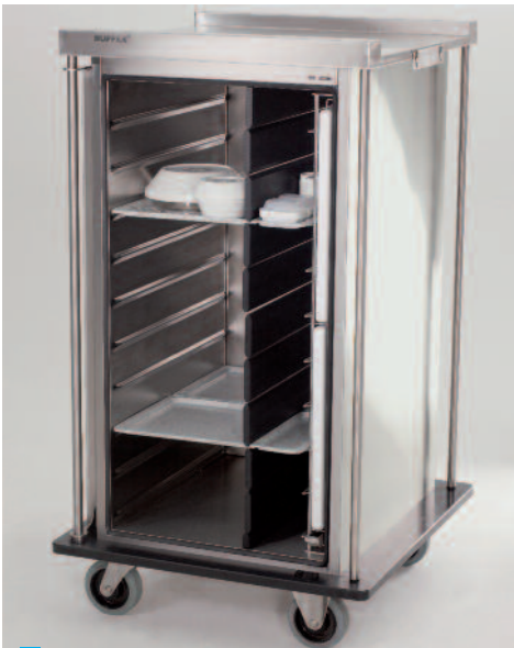
Beispielbestückung „Mittagessen“ mit Warmhalteunteilen (Wachspellets) sowie Porzellan-Norm-Geschirr im Kaltbereich.