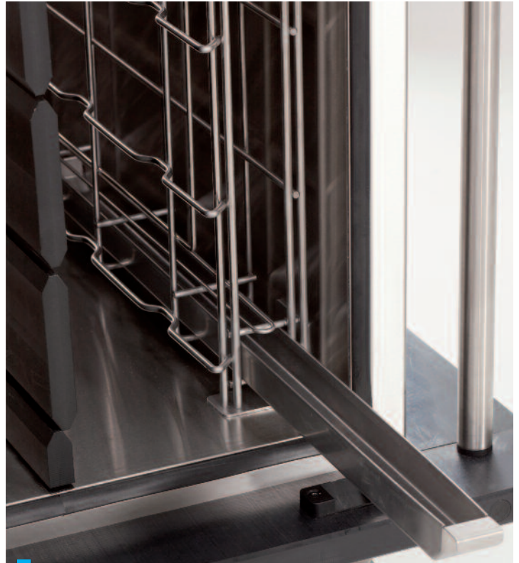
Integrierte Tropfwanne unter den eutektischen Platten entnehmbar.