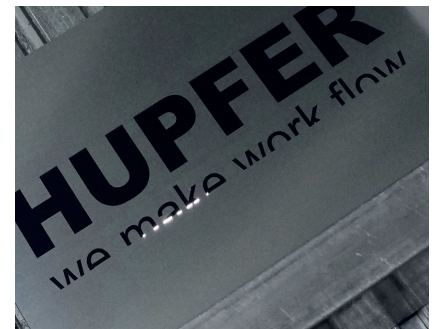
3-D, laser, robotics: bij ons dagelijks in gebruik