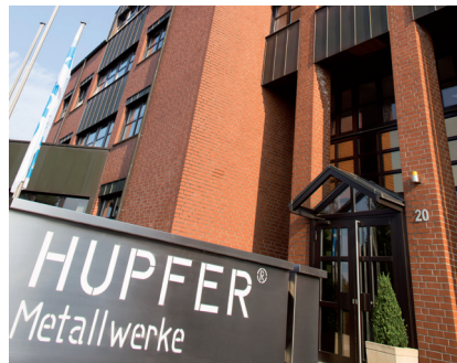
Ons hoofdkantoor in Coesfeld, Westfalen